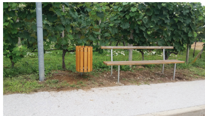
Produkti dela lepšajo okolico

Prosimo vas, da nam izpolnjene ankete vrnete, da jih lahko analiziramo in urgiramo skladno z vašimi pričakovanji.