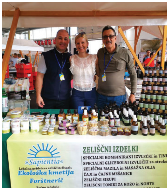
Županja obiskala stojnico v Celju

avoslovja in antropozofske medicine v Švici, Nemčiji in Avstriji.