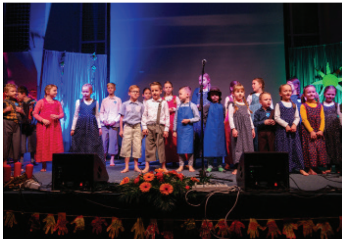
Otroci so naše največje bogastvo

Da v Slovenskih goricah prevladujejo mladi, kažejo podatki za našo občino, ki se s 16,1 odstotnim deležem mladih do 14 let uvršča na tretje mesto v Podravju. Prav tako je število najmlajših prebivalcev, kar je lastnost le redkih slovenskih občin, večje od števila najstarejših.