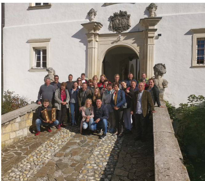
Skupinska fotografija pred gradom