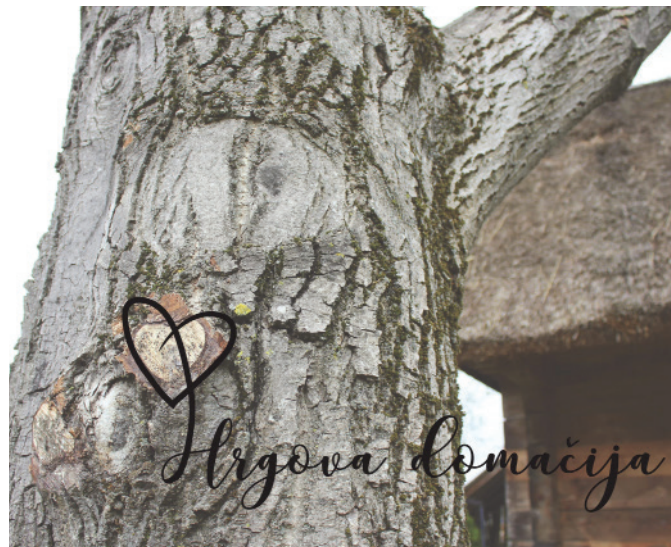
Hrgova domačija izbrana v javnem natečaju

V mesecu juliju je Znanstveno raziskovalno središče Bistra Ptuj v sklopu mednarodnega projekta Houses, v katerem sodelujejo kot projektni partner, razpisala Javni natečaj za podeželske hiše.