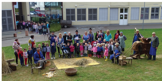
Prikaz starih običajev vrtcu in osnovni šoli

V mesecu septembru smo se s prikazom starih običajev »Mlatci in drugi« predstavili še našim najmlajšim v vrtcu in POŠ Vitomarci. Otroci so ob predstavitvi navdušeno spremljali naše delo in se na koncu še sami preizkusili v različnih opravilih.