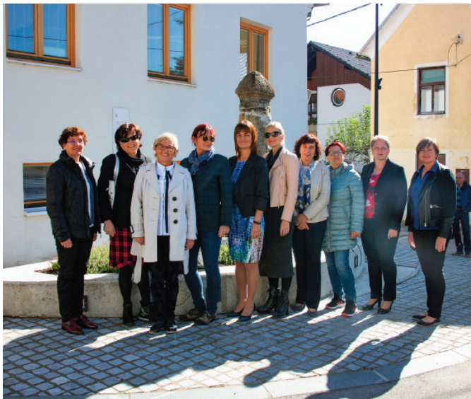
Županje tokrat o turističnih izzivih

V petek, 11. oktobra 2019 je na Rečici ob Savinji potekalo 4. srečanje kluba županj.