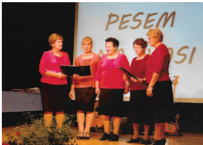
Naše ljudske pevke