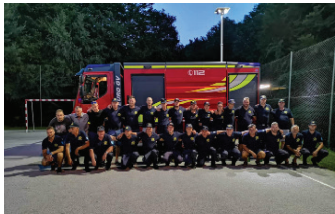
Veliko aktivni gasilci

V letošnjem letu (do 10.12.2019) smo gasilci PGD Vitomarci imeli 13 intervencij. Desetkrat smo posredovali v naši občini, trikrat pa smo pomagali v sosednji Trnovski vasi. Od tega je bilo sedem požarov in pet primerov druge pomoči.