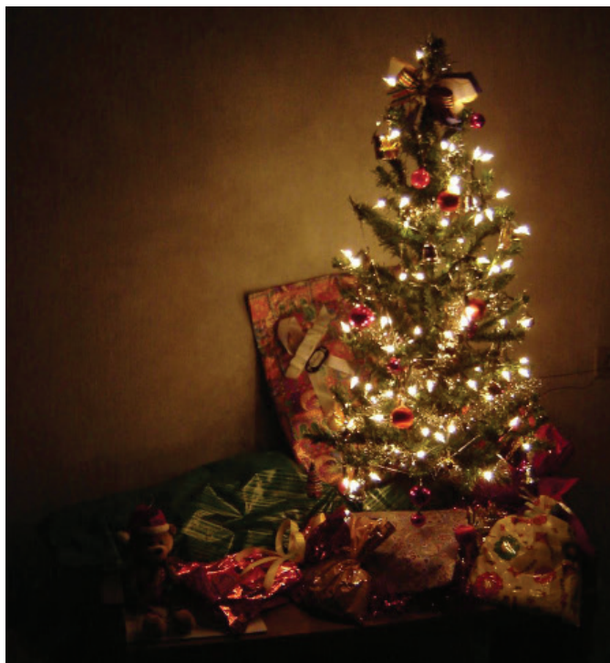
Letošnji prazniki za najbolj ogrožene starejše drugačni

Bliža se praznični čas, prižgale so se lučke, dišalo bo po piškotih. Ob tem času si vsi želimo biti obdarjeni, ne glede na starost. Predvsem ne smemo pozabiti starejših, ki so se zaradi različnih okoliščin znašli sami, z minimalno pokojnino in bi bili prav tako veseli pozornosti. Tu gre za starejše ljudi, ki imajo najnižje pokojnine, živijo v pomanjkanju in jim za življenje ne ostane praktično nič.