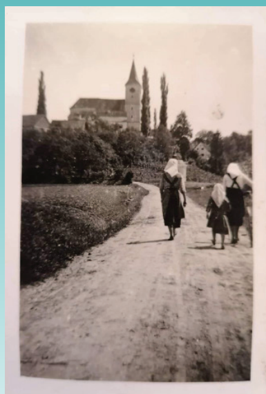
#andraz365#day233 avtor: Rudi Vršič