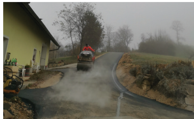
Cesta pomembna tudi za razvoj turizma

Konec meseca novembra je bila na Ostragovi končana investicija obnove vodovodnega omrežja in cestišča v dolžini 390 metrov.