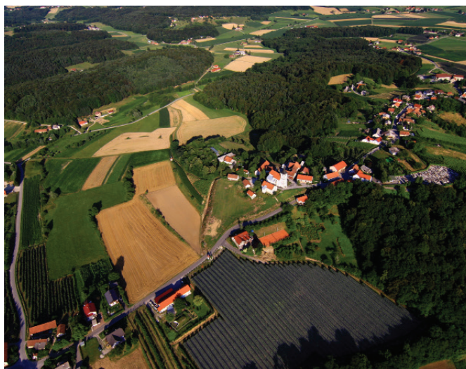
Sprejem prostorskega akta omogoča nadaljnji razvoj

Občinski svet Občine Sveti Andraž v Slovenskih goricah je na svoji 7. redni seji v mesecu oktobru sprejel prve spremembe in dopolnitve Občinskega prostorskega načrta občine. V postopku smo se tri leta usklajevali z nosilci urejanja prostora. Veliki večini pobudam je bilo ugodeno, vsem žal ne. Sprejem tega prostorskega akta ima za občino izjemen pomen, saj smo s sprejetjem akta veliko posameznikom, podjetjem in kmetijskim gospodarstvom omogočili nadaljnji razvoj.