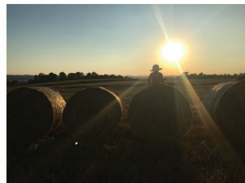
#andraz365#day210 avtor: Hermina Fridau Dolinar