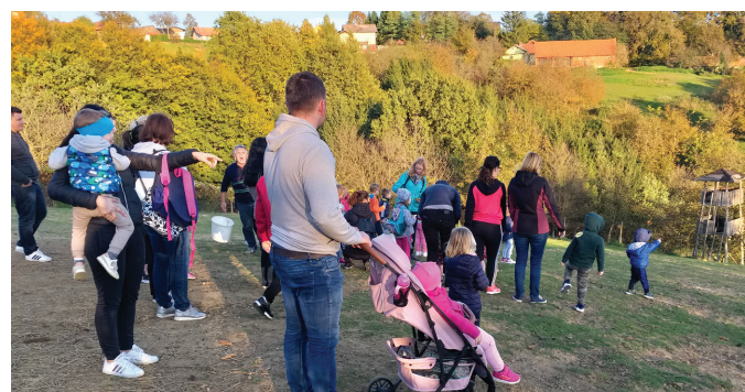
Na obisku pri Rebrevčevih