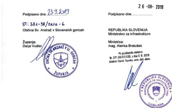
Podpisan dogovor o sofinanciranju

Prva faza investicije se bo pričela od pričetka naselja Vitomarci do križišča Berlak, kjer bo urejeno križišče, in naprej pod Mužami do križišča proti Cerkevniku. Naslednji dve fazi bosta zajemali ureditev od križišča do meje s Cerkevnikom ter od konca naselja Vitomarci do meje z občino Juršinci.