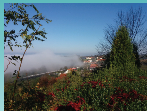
#andraz365#day321 avtor: Dejan Ilesič