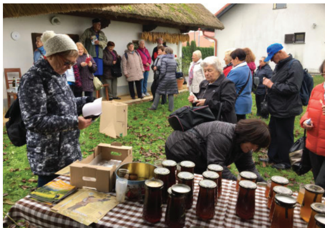
Obisk turistov v naši občini skokovito narašča

Občina Sveti Andraž v Slovenskih goricah, je zadnja leta na turističnem področju kar precej napredovala, za kar gre zasluga tudi mednarodnim projektom, ki smo jih izvajali in v okviru katerih smo uredili dva turistična produkta. Hrgovo domačijo in muzejsko interaktivno učilnico.