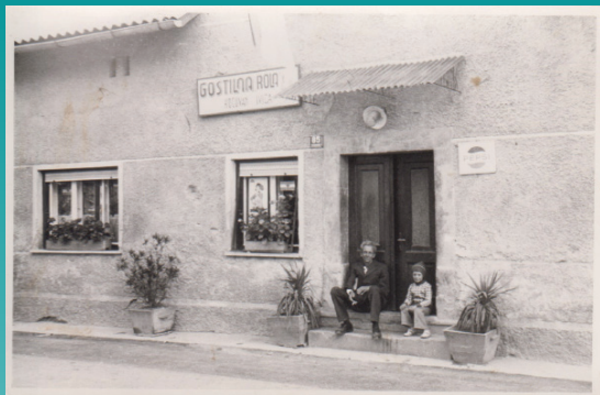
#andraz365#day346 avtor: Ivan Fras

Vir: facebook stran občine Sveti Andraž v Slov. goricah #andraz365#day200-day346 avtorji