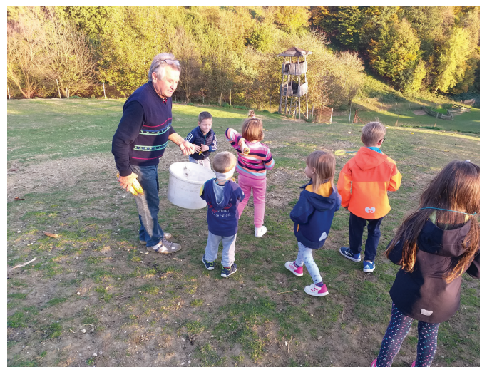
Hranili smo živali