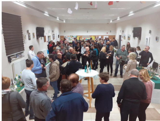
Prireditev je privabila veliko obiskovalcev, letos predvsem iz drugih krajev