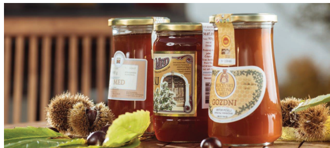
Letina medu slabša kot v povprečju

Na slovenskem trgu boste lahko kupili tudi med označen z oznako ene izmed shem kakovosti, kar kaže na posebnost ali višjo kakovost proizvoda. Na področju medu poznamo tri zaščitene geografske poimenovanja medu priznane na evropskem nivoju in sicer Slovenski med z zaščiteno geografsko označbo, Kočevski gozdni med in Kraški med, ki nosita zaščiteno označbo porekla. Nekateri čebelarji pa se vključujejo tudi v ekološko pridelavo medu.