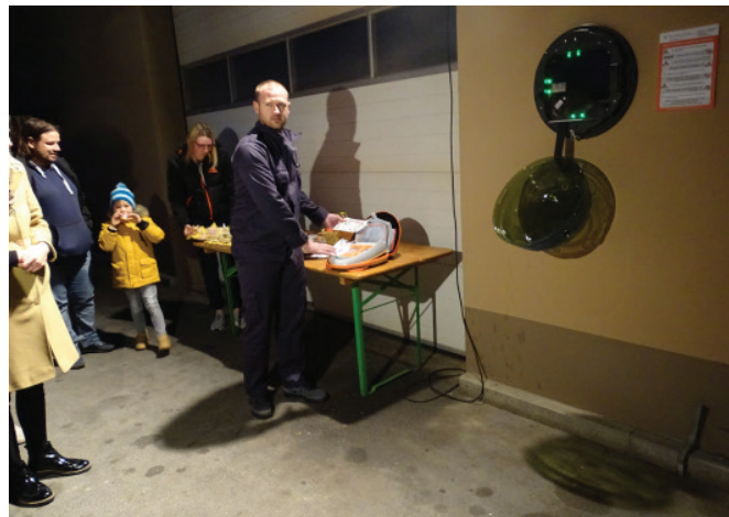
Prikaz uporabe defibrilatorja