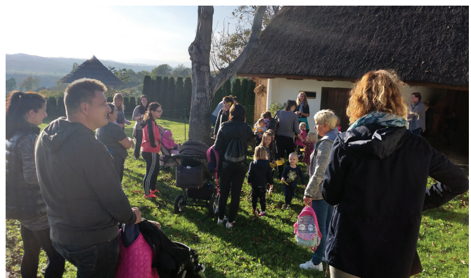
Pri Hrgovi domačiji