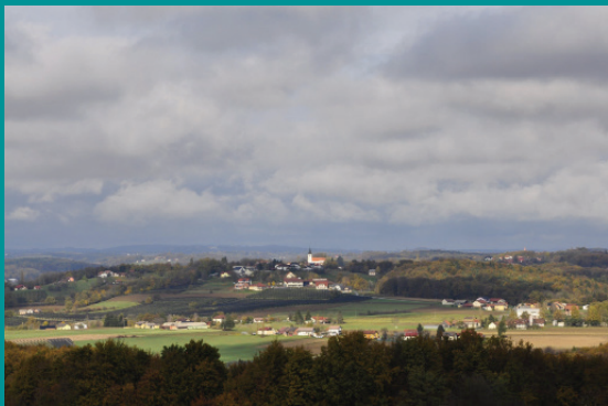
#andraz365#day343 avtor: Bogdan Berlak