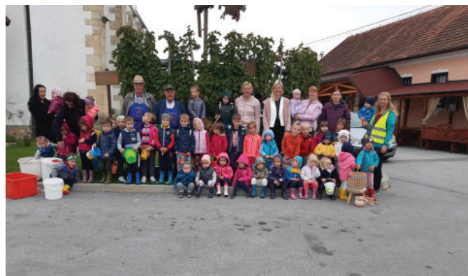
Mladi berači: prihodnost kraja in društva

Trgatev je potekala 18. septembra v društvenem ampelografskem vrtu, trganje jabolk pa 25. septembra v sadovnjaku Šilec. Delo je potekalo v prijetnem vzdušju, navdušeni so bili vsi. V bodoče si želimo še več takšnih dogodkov.