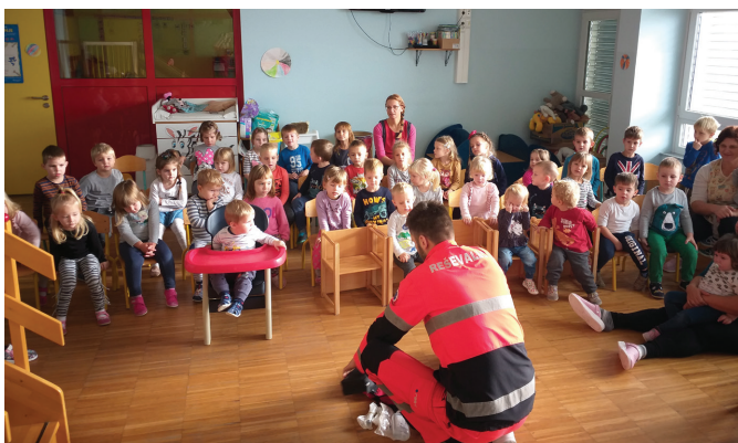
Predstavitve poklica reševalca