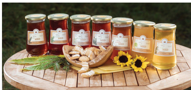
Med kot odlično darilo