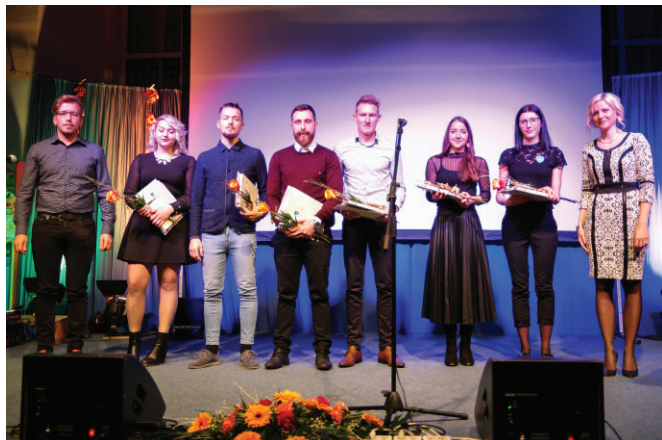
Uspešnim dijakom in študentom sta pohvale in nagrade podelila županja in podžupan