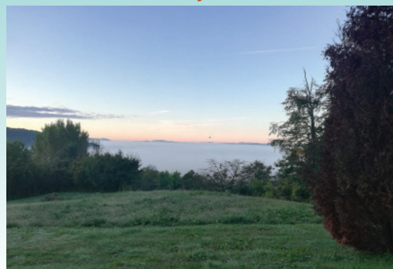
#andraz365#day320 avtor: Mateja Sedlašek