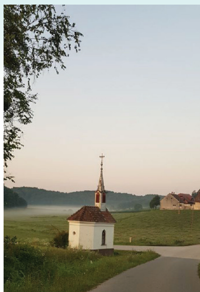
#andraz365#day217 avtor: Iztok Anželj